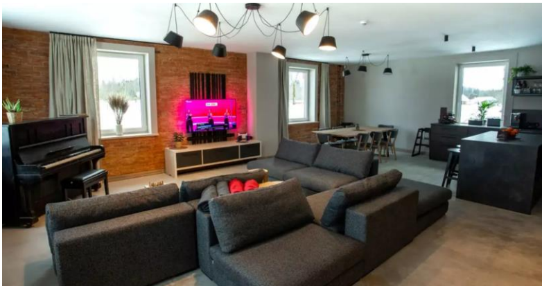
Joonis 3. Köstrimõisa turismitalu puhketuba (2023)

Köstrimõisal on oma asukoha tõttu head arenemisvõimalused. (Rence 2023)