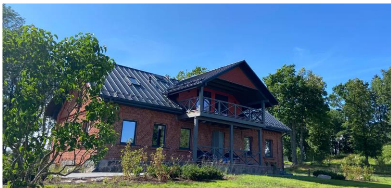
Joonis 2. Köstrimõisa turismitalu peamaja (2023)

Köstrimõisa talu on olnud jõukas talu. Seda võib järeldada olemasolevate hoonete põhjal (peamaja, moonakate maja, laudad). Kahjuks on talu ajaloo kohta säilinud väga vähe informatsiooni.