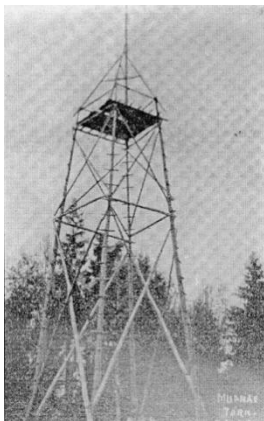
Joonis 2. Esimene vaatetorn

Juba ammu on püütud Munamäe tippu püstitada ehitist, mis laiendaks silmaringi kaugemale ümbruskonnale. 1812. aastal olevat soldatid vene ohvitseri juhtimisel ehitanud Munamäele esimese torni. "See olnud nii kõrge, et hakanud eksitama merelaevu ja seetõttu lammutatud", räägib rahvasuu. (Suur Munamägi, 2013)