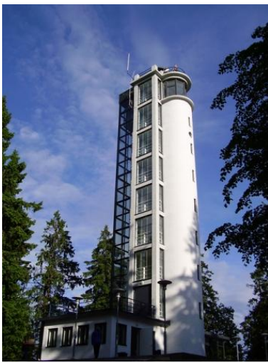
Joonis 5. Vaatetorn aastal 2005

24. juulil 2005. a. toimus renoveeritud Suure Munamäe vaatetorni pidulik avamine. (Suur Munamägi, 2013)