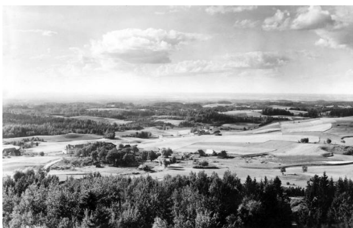
Joonis 1. Vaade Suurelt Munamäelt.

Kui aga vaade Munamäe otsast on sompus ilma tõttu vilets, saab uhke tunde kõrgel asudes kätte teisel kombel. Kui pilved nii madalalt käivad, et ümbritsevate mäeharjade tippe riivavad, et tundu mäe kohta käiva ärkamisaegse laulusõnad: „Kui siit pilvepiirilt alla vaatan...“, enam sugugi ülepakutuna. (Relve 2008: 163)