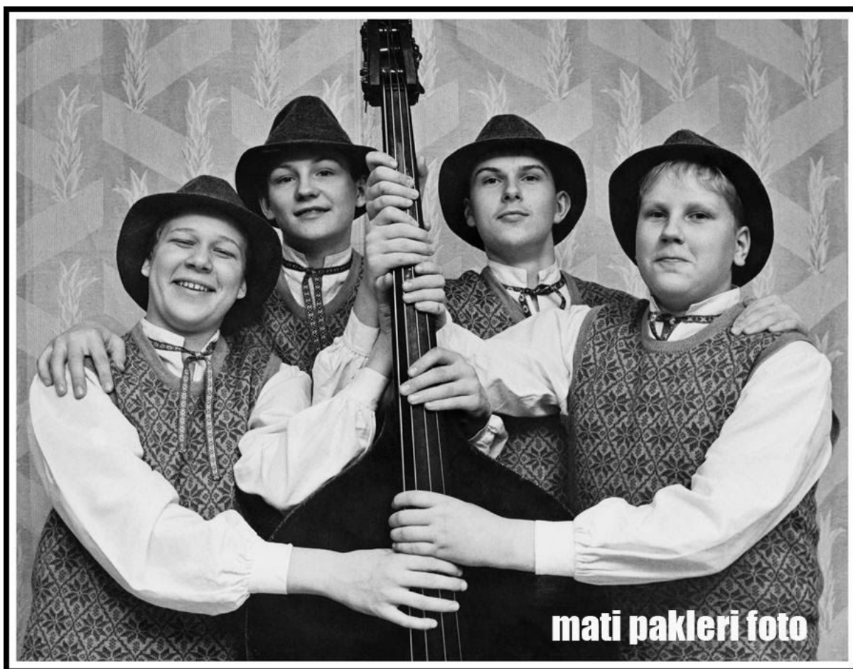
Joonis 5. Foto näituselt. Ansambel UMMAMUUDU esimene grupipilt.

Rääkides nüüd aust ja kuulsusest, mida tõi kaasa võidud erinevatel konkurssidel, pole vanaisa eriti hoolinud. Ta pole kunagi seadnud eesmärgiks jahti aunimetustele ega tiitlitele - see on kõik on tulnud kuidagi iseenesest. Aga ikkagi on uhke vaadata, kui vanaisa pilt on mõne vana ajalehe veerul ilmunud.